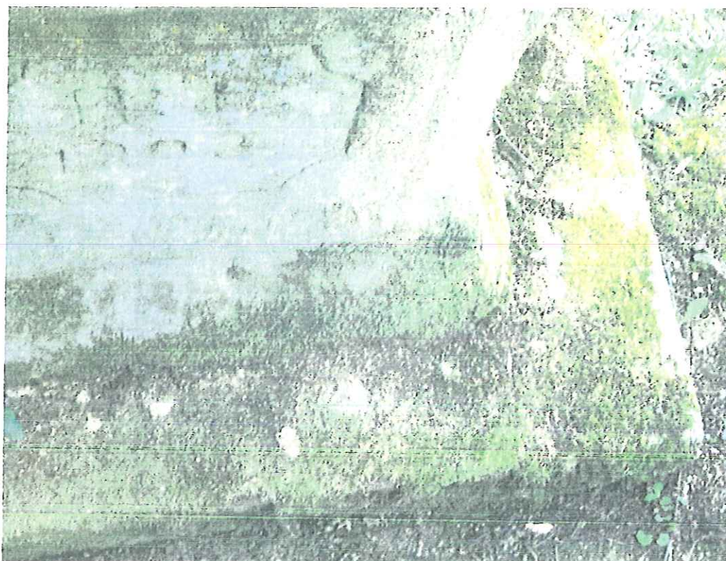
Fot.nr 9. Tropie –kapliczka słupowa-detale. Stan kwiecień 2018.