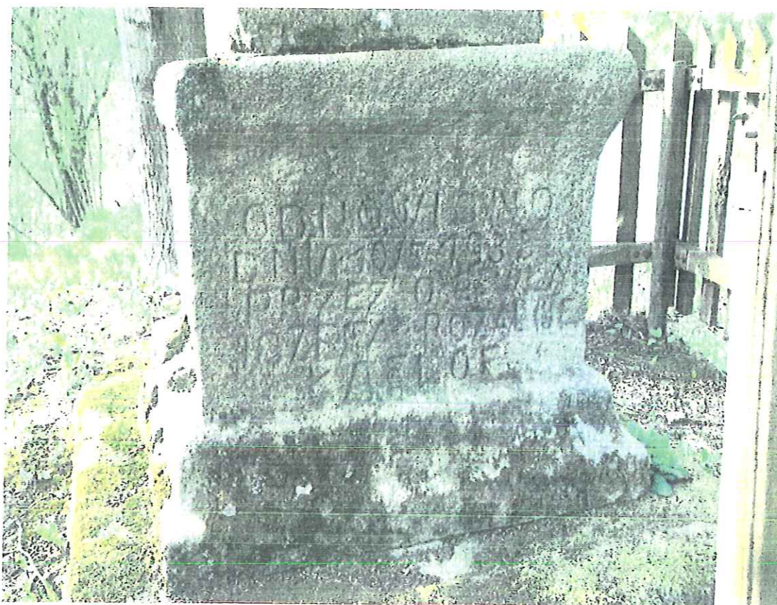
Fot.nr 1 Tropie –kapliczka słupowa-detal. Stan kwiecień 2018.