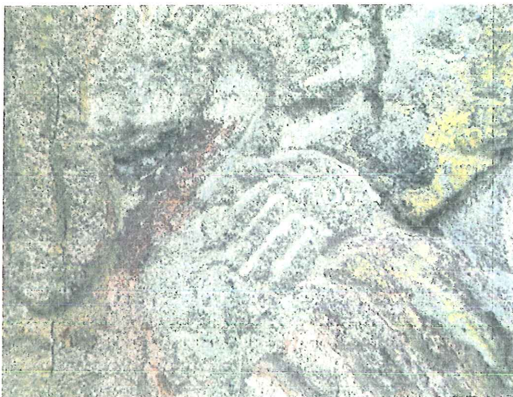
Fot.nr 6. Tropie –kapliczka słupowa-detal. Stan kwiecień 2018.