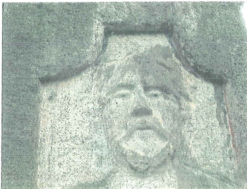
Fot.nr 5. Tropie –kapliczka słupowa-detale. Stan kwiecień 2018.