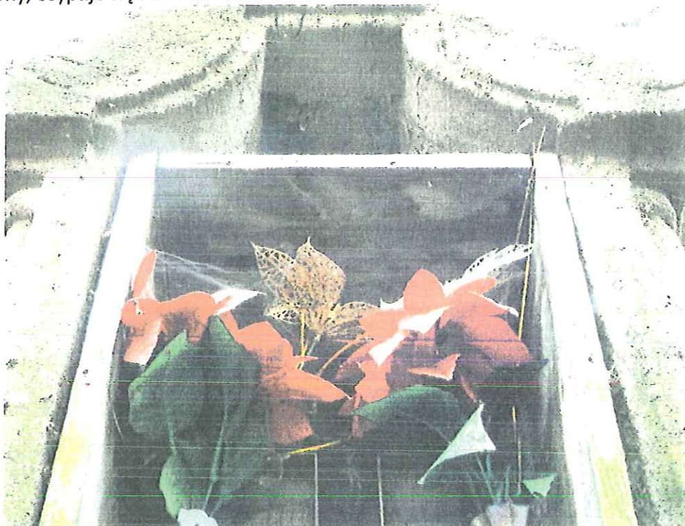
Fot.nr 2 Tropie –kapliczka słupowa-fragment. Stan ;kwiecień 2018

porosty. Na powierzchni występują liczne wżery, nacieki, mikroszczeliny i pęknięcia. Kamień jest osłabiony, osypuje się i rozwarstwia.