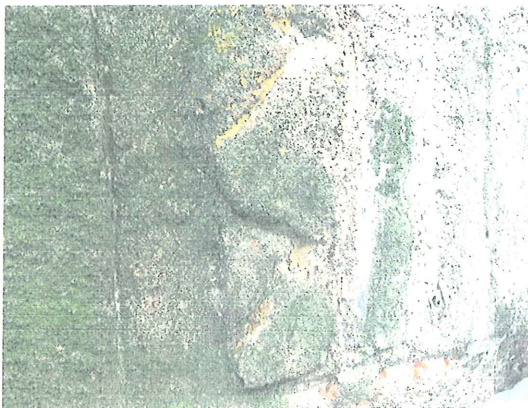
Fot.nr 8. Tropie –kapliczka słupowa-detal. Stan kwiecień 2018.