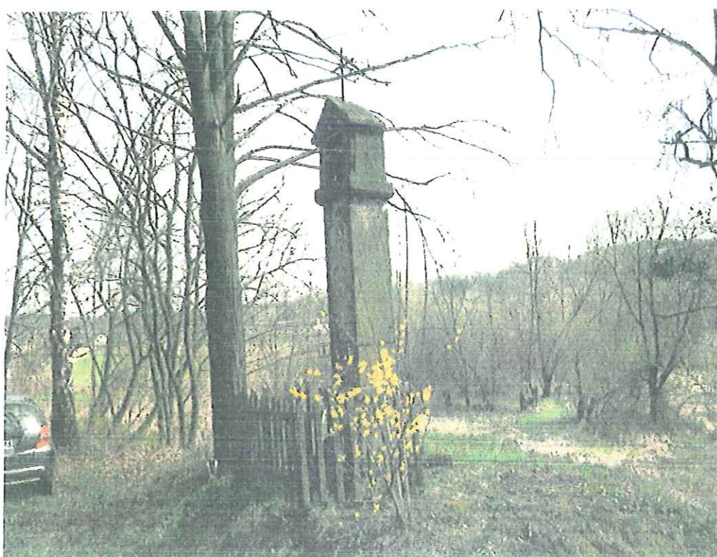
Fot.nr 3 Tropie –kapliczka słupowa. Stan ;kwiecień 2018